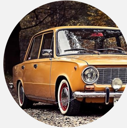
“Varaosahuolto ja öljynvaihto”